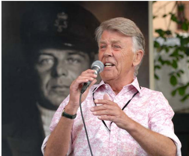
Sven-Bertil Taube